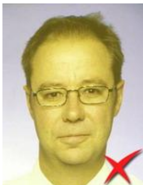
Nuanțe nenaturale ale pielii

Portretul să fie în culori neutre, prezentând persoana cu ochii deschiși și vizibili. Se recomandă o reglare a expunerii cu ponderea de gri în alb de 18%. În zona feței se recomandă 128 de niveluri în intervalul dinamic. Standardul ISO nu permite modificarea digitală a imaginii pentru a corecta intervalul dinamic sau culorile.