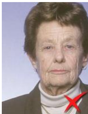
Fața nu este centrată