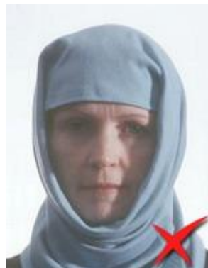
Umbre pe față