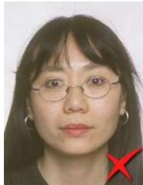
Ochii parțial acoperiți