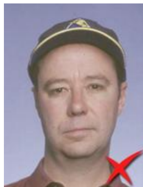
Nu se acceptă