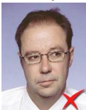
Nu privește la aparat