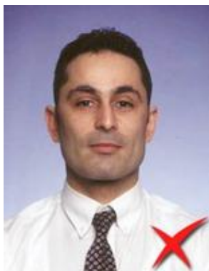
Prea de departe