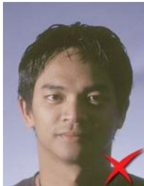
Umbre pe față