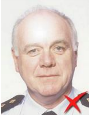
Reflexie pe față

Iluminarea trebuie să fie uniformă, fără umbre și fără reflecții pe față, fără ochi roșii și fundalul să nu prezinte vre-o umbră remarcabilă.