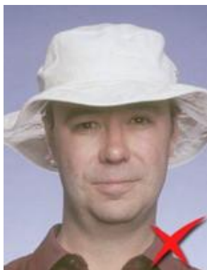
Nu se acceptă

Acoperirea capului nu se acceptă decât în cazurile aprobate prin lege. Aceste cazuri pot fi de ordin religios, medical sau cultural.