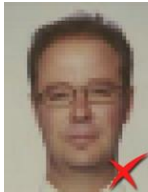
Pixelată (calitate scăzută)