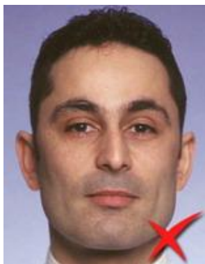
Prea de aproape

Distanța dintre camera foto și persoana fotografiată nu trebuie să fie nici prea mare, nici prea mică: în fotografie distanța dintre ochi trebuie să fie un pic mai mică decât 1/4 din lățimea imaginii. Fața trebuie să fie centrată atât pe verticală cât și pe orizontală. Fundalul trebuie să fie uniform.